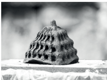
Bjørn Nørgaards første skitsemodel, juni 2024. Den færdige brønd støbt i bronze blev opstillet i få dage før indvielsen den 21. august 2025.